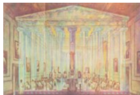
Gedachtenvorm van de perfecte tempel