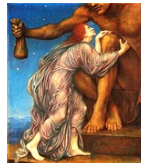
De aanbedding van Mammon