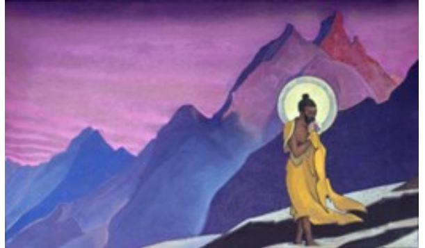
Nicolas Roerich - Blessed Soul

Een van de grondbeginselen van theosofisch denken draait om broederschap (zusterschap), of om onze gemeenschappelijke basisvorming als mensen. Natuurlijk hebben wij allemaal affiniteit met het eenheidsprincipe, dat is gemakkelijk. Als we dat begrepen hebben kunnen wij doorgaan met de Geheime Leer, het betere werk. Maar even zonder gekheid, ik denk dat het probleem is dat wij, totdat wij broederschap onder de knie hebben, nooit iets anders kunnen begrijpen. (Door deze bewering zullen velen zich op hun teentjes getrapt voelen).