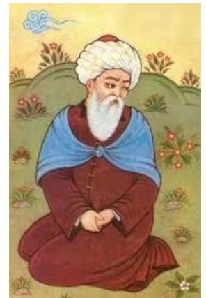
Jami (1414-1492) Perzische mysticus, dichter en theoloog

Evolutie is een enorme beweging die levende wezens brengt tot volmaking en het hoogste bewust-