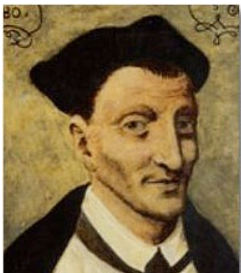
Thomas a Kempis (ca 1380-1471)

Thomas a Kempis verheldert dit als volgt in De Navolging van Christus : 'Er zijn mensen die zich overgeven, maar er zijn ook uitzonderingen; want zij schenken niet hun hele vertrouwen aan God, daarom bezinnen ze zich hoe ze voor zichzelf kunnen zorgen.