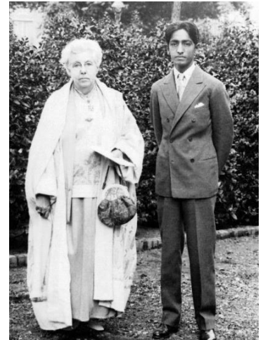
Annie Besant & J. Krishnamurti

Samen met Charles Webster Leadbeater schreef ze een aantal boeken en ze hielp met de opvoeding van Jiddu Krishnamurti, waarvan zij wereldkundig maakte dat hij een wereldleraar zou worden. Hoewel de laatste het niet eens was met haar invulling van dit begrip en de organisatie die voor hem werd opgericht ophief, bleven zij tot het laatst een innige relatie onderhouden.