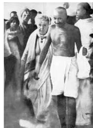
Annie Besant & Mohandas K. Gandhi - 1921

Na het schrijven van een artikel over De Geheime Leer van Helena Petro van de Theosofische Vereniging. Ze vertrok naar Adyar en zette zich in v de vooruitgang en onafhankelijkheid van India.