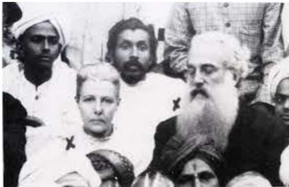
Annie Besant & Kol. Olcott Conventie in 1893 - Adyar