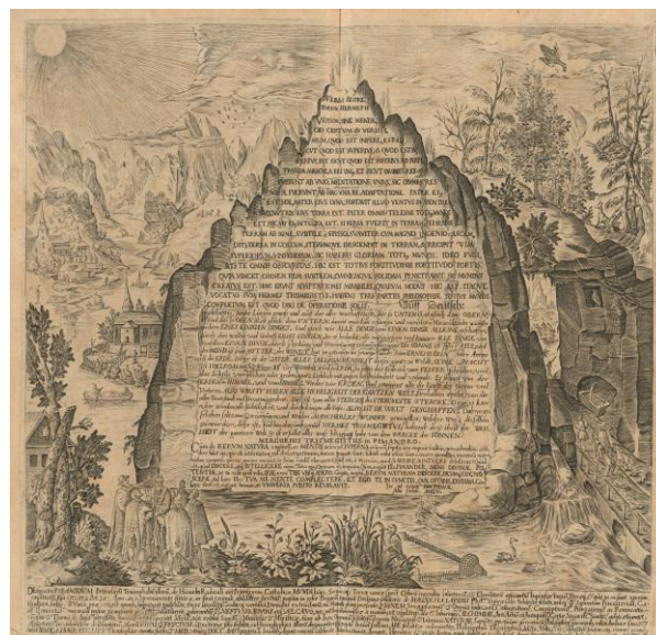
De Smaragden Tafel