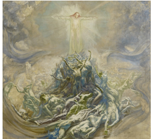
L'Homme-Dieu (1895) Jean Delville

moet worden tot gewaarszijn en het tot uitdrukking brengen van eeuwige Schoonheid. Dit is door de eeuwen heen het doel geweest van de culturele inspanningen van de mens. Liefde voor en toewijding aan schoonheid hebben, zoals reeds is uitgelegd, orde, eenheid en gerechtigheid in een beschaving voortgebracht.