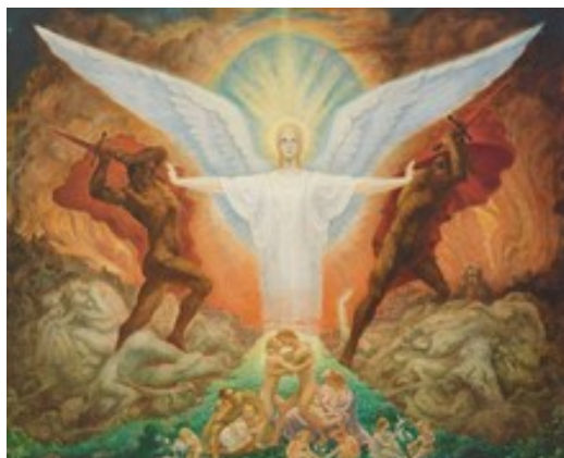
Vision de la Paix (1947) Jean Delville

In onze hedendaagse wetenschap en filosofie zowel als in religie vervangt uiterlijke schoonheid gewoonlijk de eeuwige Schoonheid, het kleed van het Ene Leven, zoals dat door individuele ervaring is waargenomen. De verantwoordelijkheid van de kunstenaar hiervoor geeft reden tot ongenoegen met het huidige wereldbeeld. Er bestaat een verband tussen een niet goed functionerende sociale orde en het verval van kunst en haar filosofie over schoonheid. Dat wil niet zeggen dat ieder veranderend gezichtspunt, een teken van verval is. Maar de weloverwogen verwerping van schoonheid als het natuurlijke kleed van universele orde en een klaarblijkelijke voorkeur voor sensationele waarden en zelfs voor grote gewelddadigheid geeft de tegenwoordige beschaving aanleiding tot het uitlokken van een ramp. Is de moderne kunst betrokken bij schoonheid? Dit is een toepasselijke vraag aan iedere leek die serieus aangekondigde tentoonstellingen bezichtigt. Het is een treurig feit dat kunst, eens de hogepriesteres van dat wat schoonheid is, uit dat ambt is ontzet en schaamteloos is vervangen door wat gelijkstaat met reclame.