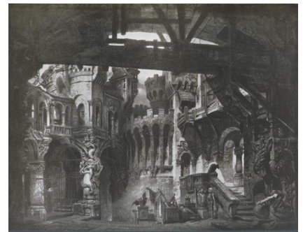
Kingsors kasteel

slingert de Speer naar Parsifal, maar het is verboden om deze heilige Speer – de Wil – voor het zelf te gebruiken en, in plaats van doel te treffen, blijft hij hangen boven het hoofd van Parsifal. Een vergelijkbaar verhaal vinden