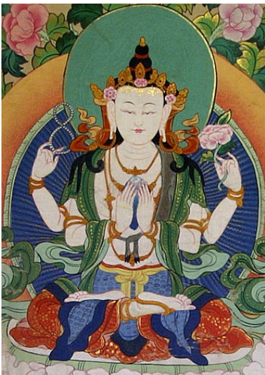
Vierarmige Tibetaanse vorm van Avalokiteshvara

In het evangelie van de heilige Mattheus in het Nieuwe Testament wordt een indicatie gegeven van het soort zelfloos geven dat de realisatie van het Goddelijke verzekert. De Heer zegt: Want ik heb honger geleden en gij hebt mij te eten gegeven, ik heb dorst geleden en gij hebt mij te drinken gegeven, ik ben een vreemdeling geweest en gij hebt mij gehuisvest, naakt en gij hebt mij gekleed, ziek en gij hebt mij bezocht; ik ben in de gevangenis geweest en gij zijt tot mij gekomen. Dan zullen de rechtvaardigen hem antwoorden, zeggende: Heer, wanneer hebben wij u hongerig gezien en hebben wij u gevoed, of dorstig en hebben wij u te drinken gegeven? Wanneer hebben wij u als vreemdeling gezien en hebben u gehuisvest, of naakt en hebben u gekleed? Wanneer hebben wij u ziek of in de gevangenis gezien en zijn tot u gekomen? En de Koning zal hen antwoorden en zeggen: Voorwaar, ik zeg u, in zoverre u dit aan één van deze mijn minste broeders gedaan hebt, hebt u het mij gedaan (Matt.25:35).