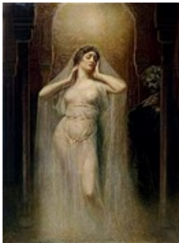
Kundry (1906) door Rogelio de Egusquiza. Museo Nacional del Prado, Madrid

slechts genezen worden door middel van de heilige Speer in de handen van de rechtmatige houder; op het Pad van Terugkeer kan slechts het Ene, niet het vele, helpen, want Amfortas staat voor het lager manas. Nu komt de wilde, vrouwelijke figuur van Kundry binnenrennen met een kleine kristal-