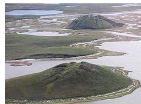
Pingo's bij Tuktoyaktuk, Noordwest Canada

De uitstoot van gassen (bijv. methaan) uit de grond is al bekend dat het moddervulkanen aan land veroorzaakt, ronde pokervlekken op de bodem van de oceaan, en 'ijsvulkanen' of pingo's op ijsvelden. Koolwaterstoffen en waterstof zijn ook belangrijke componenten van de gassen die vrijkomen bij grote vulkaanuitbarstingen.