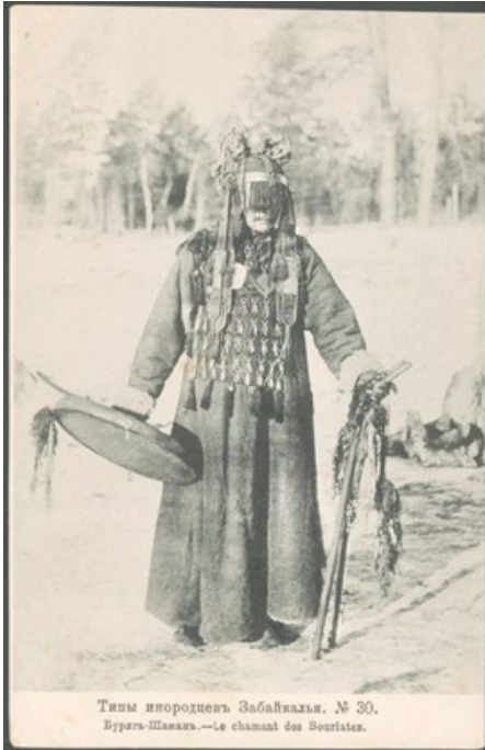
Типичный игородецъ Забайкалья. № 30. Бурага Шаманъ.—Le chaman des Bouriates.

Chaman sibérien avec son masque et tambour