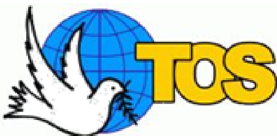
Theosophical Order of Service

Chacun de nous possède en lui-même cet idéal merveilleux et connaît des exemples concrets de serviteurs désintéressés et sincères.