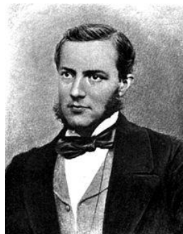
MAX MÜLLER (6/12/1823 - 28/10/1900)