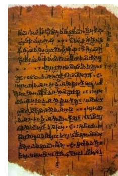
Blad uit een van de 4 Veda's