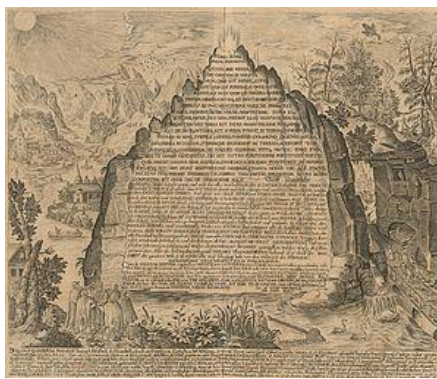
Een 17de-eeuwse afbeelding van de Smaragden Tafel door Heinrich Khunrath, 1606.