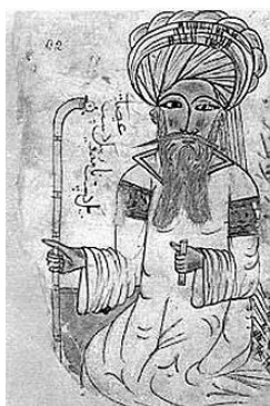
Avicenna in een manuscript uit 1271