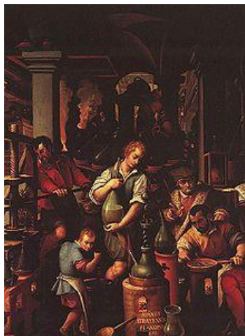
Laboratorium van de alchimist (1551)