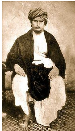
Swami Dayánund Saraswati

We zijn ons maar al te zeer bewust van het risico om wetenschappelijke autoriteiten niet op te hemelen. Toch moeten we, gezien de algemene onbezonnenheid van de andersdenkenden, onze gedragslijn bepalen, ook al worden wij, evenals de Tarpeia uit de oudheid, gesmoord onder