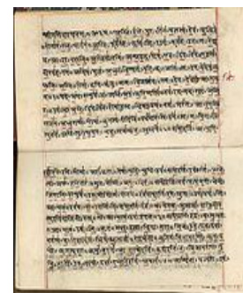
19de-eeuws fragment van de Rig-Veda geschreven in het Devanagari schrift.

De kennis van de Veda's is verdeeld over 4 delen. In deze delen staan veel onderwerpen beschreven zoals: rituelen, yoga, astrologie, filosofie, wiskunde, muziek en nog veel meer. In de boeken zijn de grondbeginselen opgenomen, later zijn deze onderwerpen in andere boeken verder uitgewerkt. De kennis in de Veda's is universeel en iedereen kan er wat aan hebben. Het is een leidraad voor het leven.