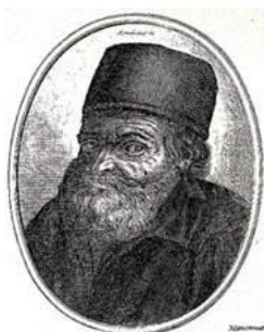
Perenelle Flamel (1340? - 11/09/1397)

Alchemie werd als meer dan een materiële kunst erkend door de psycholoog Carl G. Jung, die verscheidene boeken geschreven heeft waarin hij