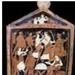
Mysteriën van Eleusis

Er is bijvoorbeeld het bekende verhaal in de Chandogya Upanishad over de student Svetaketu, wiens vader hem vroeg of hij dat ene ding geleerd had, waarna men, als dit gekend wordt, niets anders meer hoeft te weten. Natuurlijk had de jongen dat niet geleerd en dus gebruikte zijn vader geduldig vele voorbeelden om de jongen dat ene